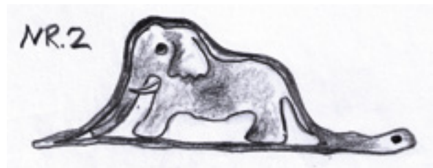
(Zeichnung nach Antoine de Saint-Exupéry)

Meine Zeichnung stellte aber keinen Hut dar. Sie stellte eine Riesenschlange dar, die einen Elefanten verdaut. Ich habe dann das Innere der Boa gezeichnet, um es den großen Leuten deutlich zu machen. Sie brauchen ja immer Erklärungen. Hier meine Zeichnung Nummer 2: